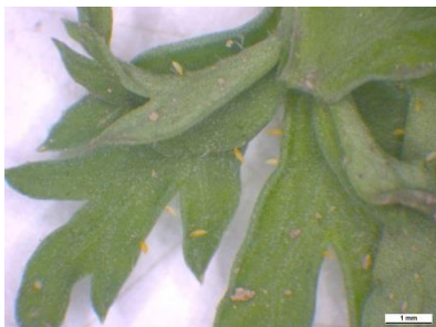
Foto 20: Orange-gelbe stiftförmige Eier des Möhrenblattfloh an einem Karottenblatt (Foto: H.P. Buser, Agroscope).