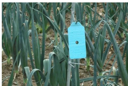
Foto 2: Blaue Klebefalle des Typs Rebell® blu zur Überwachung von Thripsen in Liliengewächsen.