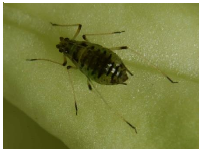
Foto 4: Erwachsene Grüne Salatlaus an einem Salatblatt.