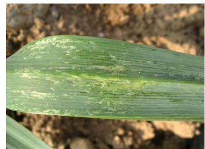
Foto 15: Weiss-silbrige Saugflecken von Zwiebelthripsen an einem Lauchblatt.