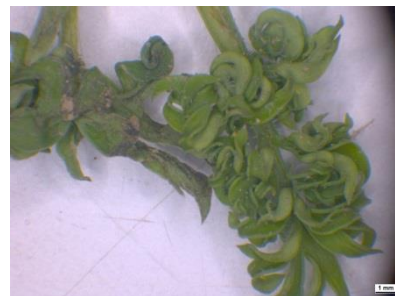
Foto 21: Blattkräuselung eines Karottenkeimlings durch Befall mit dem Möhrenblattfloh.