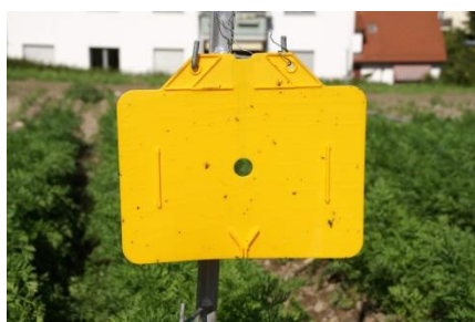
Foto 3: Orange Klebefalle des Typs Rebell® orange zur Überwachung der Möhrenfliege und des Möhrenblattflohs in Doldenblütlern (Foto: C. Sauer, Agroscope).