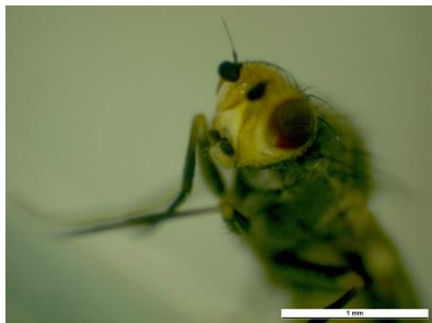
Foto 10: Erwachsene Lauchminierfliege (Foto: W.E. Heller, Agroscope).