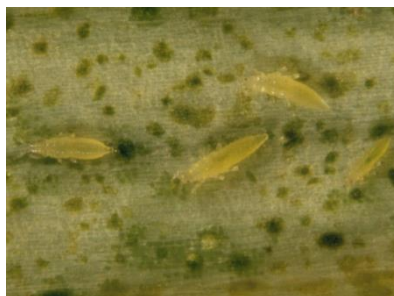
Foto 14: Gelbe, stiftförmige Thripslarven an einem Zwiebelblatt.