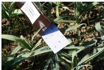
Foto 1: Pheromonfalle zur Überwachung der Lauchmotte in Liliengewächsen (Foto: C. Sauer, Agroscope).