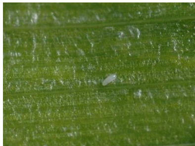
Foto 11: Ei der Lauchminierfliege im Inneren eines Schnittlauchblattes (Foto: R. Total, Agroscope).