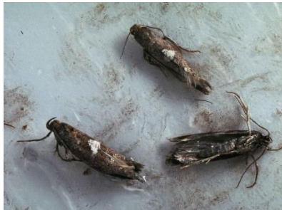
Foto 7: Lauchmottenfalter auf dem Leimpapier einer Pheromonfalle.