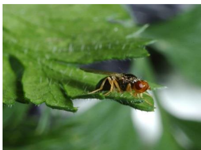
Foto 16: Erwachsene Möhrenfliege auf einem Karottenblatt (Foto: H.U. Höpli, Agroscope).