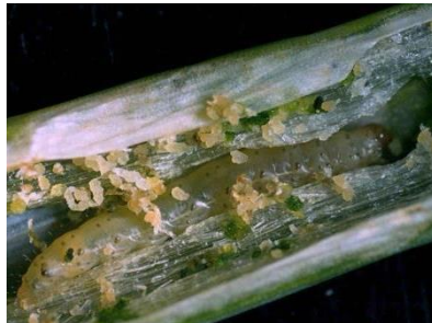
Foto 8: Raupe der Lauchmotte mit ihren Kotkrümeln in einer Zwiebelröhre (Foto: U. Remund, Agroscope).