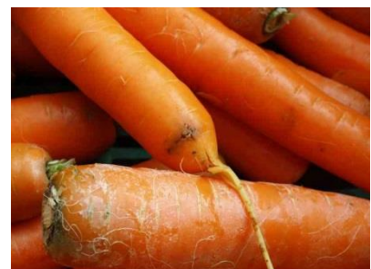
Foto 18: Brauner Frassgang einer Möhrenfliegenlarve an der Spitze einer Karotte.