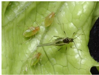
Foto 5: Geflügelte Grüne Salatlaus mit drei Larven (Nymphen) an einem Salatblatt (Foto: H.U. Höpli, Agroscope).