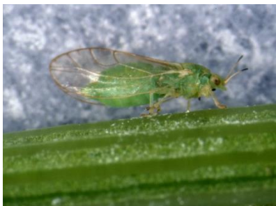
Foto 19: Erwachsener Möhrenblattfloh an einem Blattstiel.