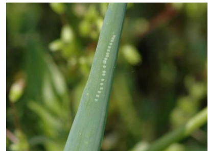
Foto 12: Saugpunkt-Kette der Lauch- minierfliege an der Spitze einer Zwiebelröhre.