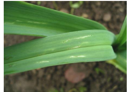
Foto 9: Feine Frassgänge von Jung- raupen der Lauchmotte an einem Lauch- blatt (Foto: J. Rüegg, Agroscope).