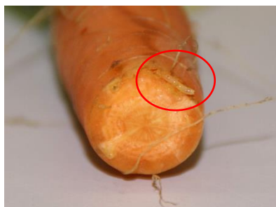
Foto 17: Möhrenfliegenlarve an einer befallenen Karotte.