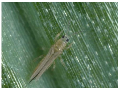
Foto 13: Erwachsener Zwiebelthrips an einem Zwiebelblatt (Foto: U. Remund, Agroscope).